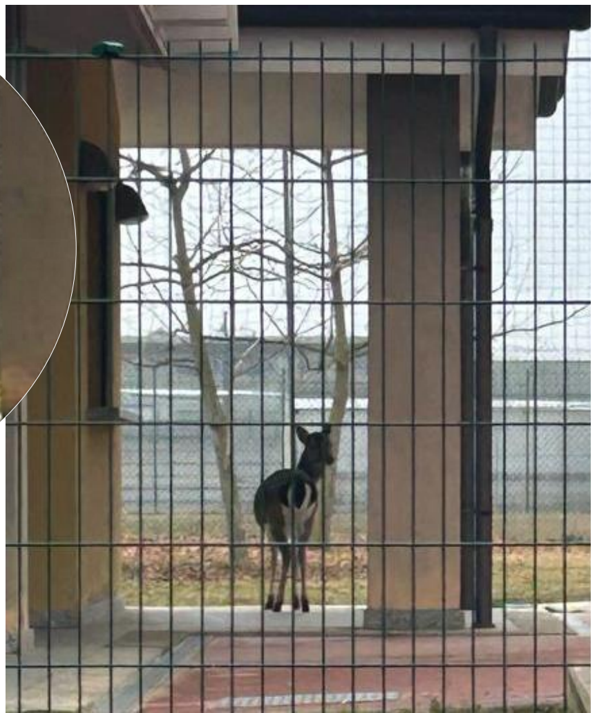
Ospite a sorpresa alla struttura!