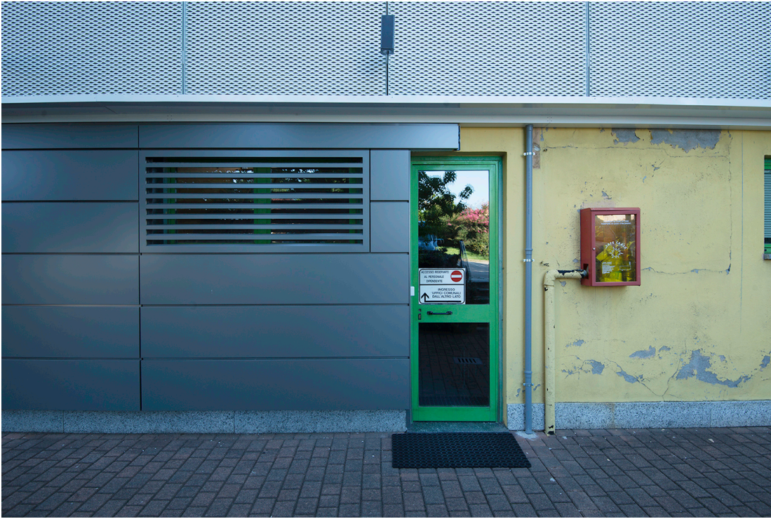
Prospetto Ovest – Fronte H