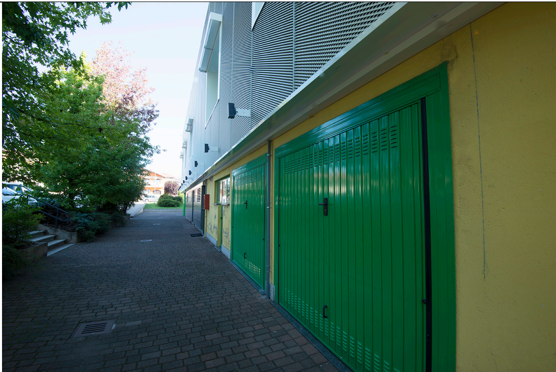
Prospetto Ovest – Fronte H