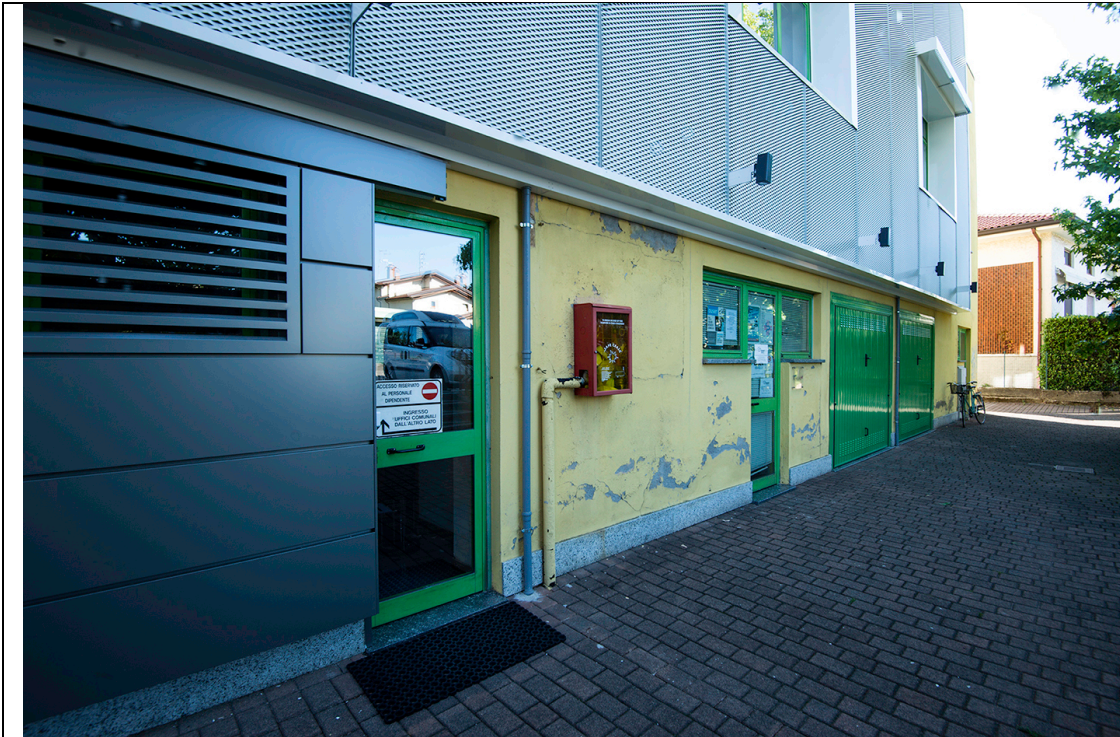
Prospetto Ovest – Fronte H