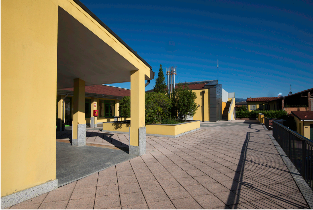
Porticati Piazza ingresso Palazzo Comunale