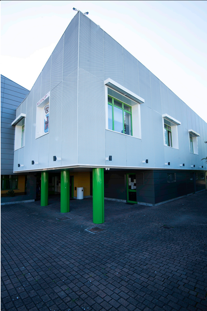
Prospetto Ovest – Fronte H