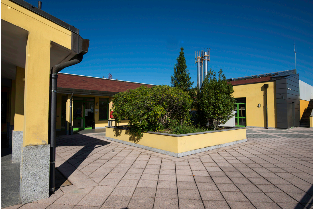
Porticati Piazza ingresso Palazzo Comunale