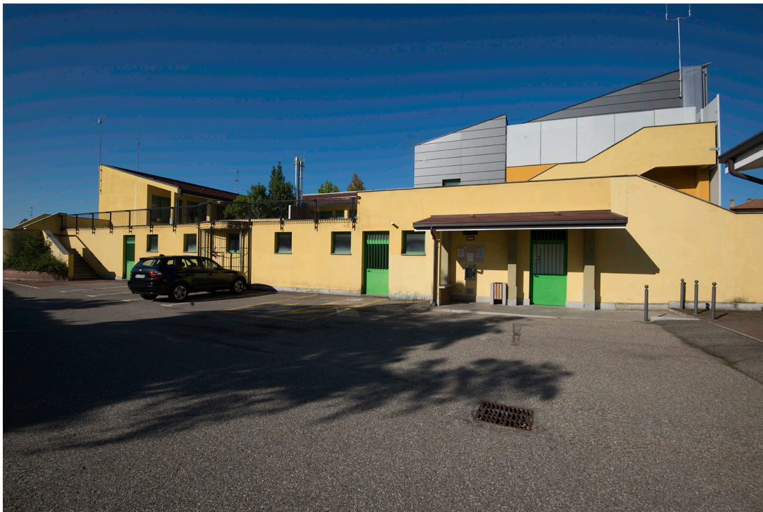
Prospetto Est – Alla estrema sinistra Fronte N