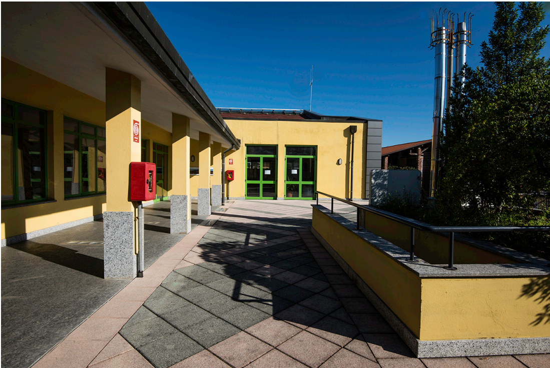
Prospetto Sud Est – Fronte Q