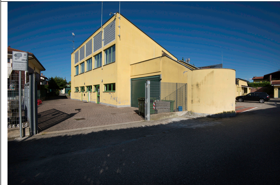
Prospetto Sud Est – Fronti M-N