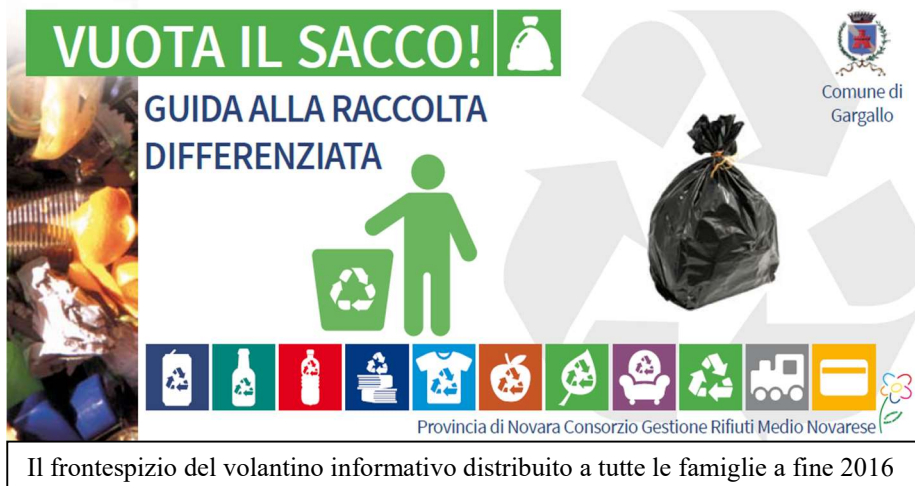
Il frontespizio del volantino informativo distribuito a tutte le famiglie a fine 2016

Gargallo, con i suoi cittadini e l'Amministrazione comunale, ha intrapreso da qualche anno a questa parte un'azione decisa contro il problema rifiuti. Nel 2016, valutando i dati forniti dal consorzio rifiuti, confrontati con quelli degli anni precedenti, si evidenziava un lento ma continuo peggioramento della differenziazione, facendoci scendere nelle posizioni basse della graduatoria dei comuni virtuosi con una percentuale di differenziazione attorno al 55%. Bisognava fare qualche cosa! Non qualcosa di banale, era necessario dare "una scossa", cambiare l'approccio organizzativo, inventare azioni che ponessero la giusta attenzione del cittadino verso il problema.