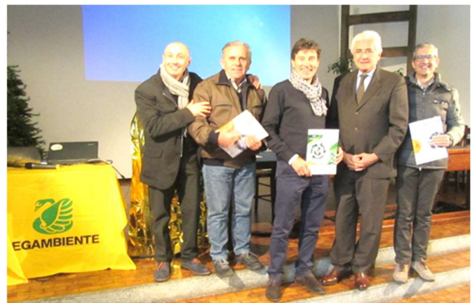
L'Amministrazione Comunale riceve il premio Comuni più virtuosi del Piemonte al Sermig di Torino

Da Marzo 2021, inoltre, partirà il nuovo appalto con il Consorzio Rifiuti. L'organizzazione delle raccolte, fino a febbraio 2022 compreso, sarà comunicata con la consegna dei nuovi calendari.